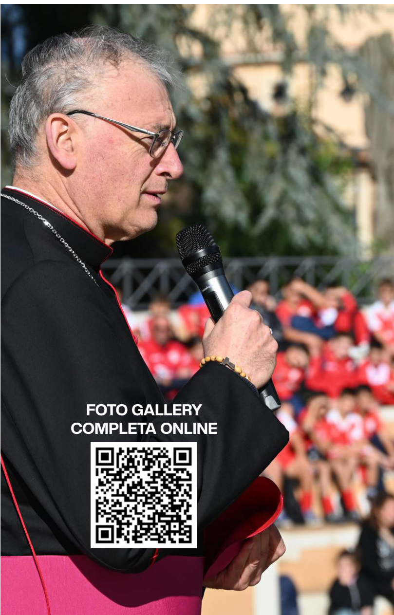
FOTO GALLERY COMPLETA ONLINE